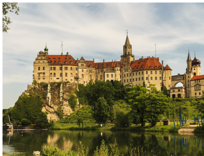
Schloss Sigmaringen

In Bad Saulgau erwartet Sie das Romantikhôtel Kleber Post, Ihr zweites Standorthotel. Genießen Sie die Annehmlichkeiten und die Atmosphäre eines traditionsreichen und geschichtsträchtigen 4-Sterne-Hotels!