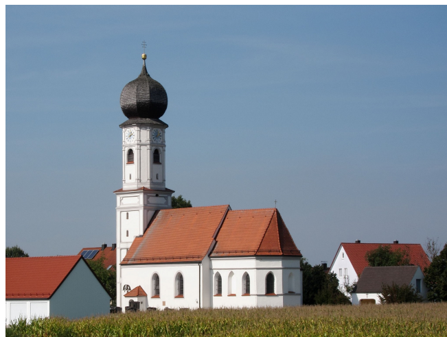
Biberach St. Martin

Heute führt Sie ein Ausflug zur berühmten Oberschwäbischen Barockstraße, in die ehemalige Freie Reichsstadt Biberach . Bei einem Rundgang sehen Sie den gut erhaltenen historischen Marktplatz mit der markanten Simultankirche St. Martin aus dem 14. Jh. Im barockisierten Innenraum sehen Sie u. a. ein monumentales Deckengemälde von Johannes Zick.