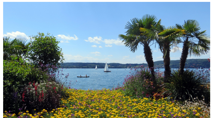
Überlingen Bodensee

Weitere wunderbare Fresken aus frühromanischer Zeit sehen Sie im Münster Sankt Maria und Markus in Mittelzell, der ältesten Kirche auf der Insel.