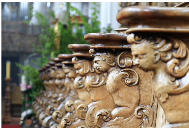
Bad Schussenried Chorgestühl