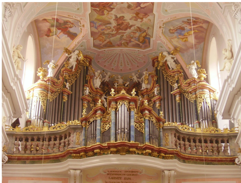
Ochsenhausen St. Georg Orgel