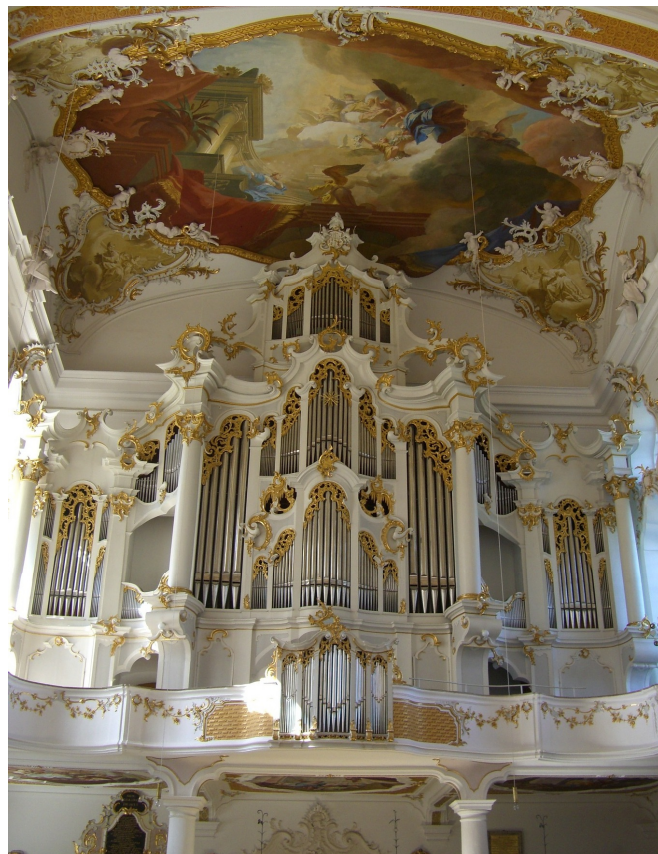
Roggenburg Klosterkirche Orgel

Am Nachmittag treten Sie die Rückreise nach Köln an, das Sie voraussichtlich am frühen Abend erreichen werden.