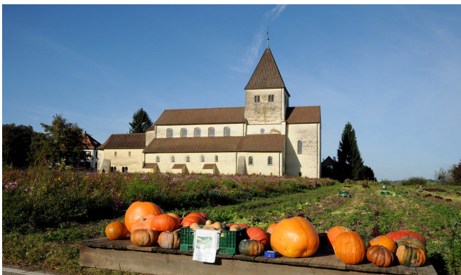
Reichenau St. Georg

Im Anschluss erreichen Sie das gemütliche, familiär geführte Hotel in Dornhan-Marschalkenzimmern im Schwarzwaldvorland für die ersten beiden Nächte.